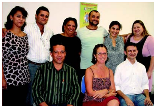
Membros do CF e dirigentes do Sintunesp, durante a posse

O Sintunesp agradece à colaboração dos servidores que participaram como mesários, que muito contribuíram para que a eleição acontecesse.